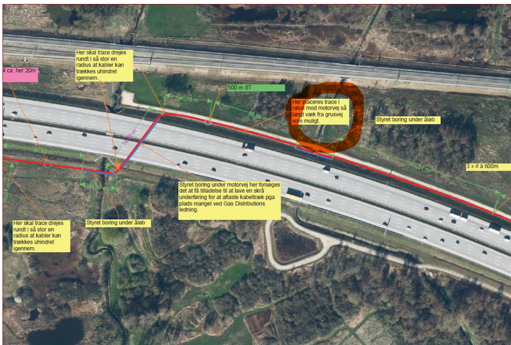
Tegningen viser hvor krydsning af vandløbet sker (rød cirkel).

Der anmodes her om krydsning af åen ved styret underboring i en dybde af 1,5m under åens bund.